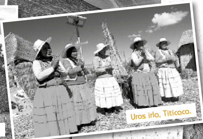
Uros irla, Titicaca.