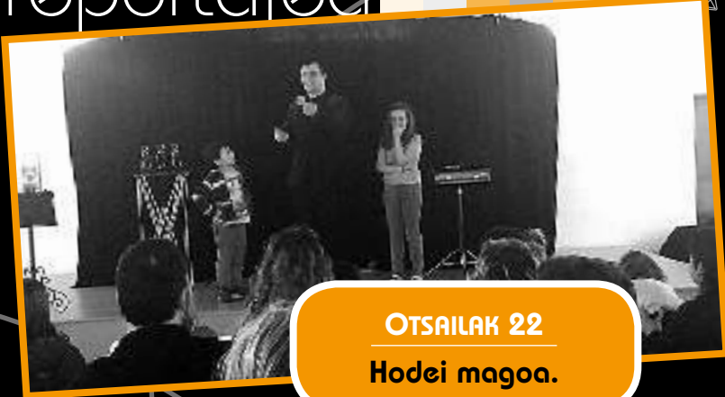
OTSAILAK 22 Hodei magoa.

Gabonetako oporrak aprobetxatuz, haurrentzako zinea antolatu genuen. Arratsalde paregabea pasa genuen bertaratu ginen haur eta helduok olentzeroen abenturak ikusiz.