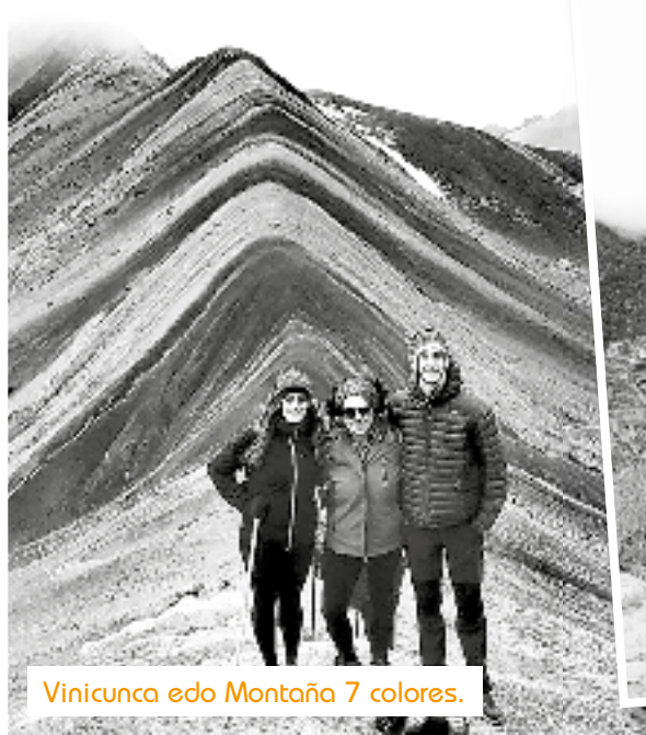
Vinicunca edo Montaña 7 colores.

Dudik gabe, Perura jon ta bixitatu gabe utzi ezin den hiria da Cusco. Inken inperioko hiriburua izantako