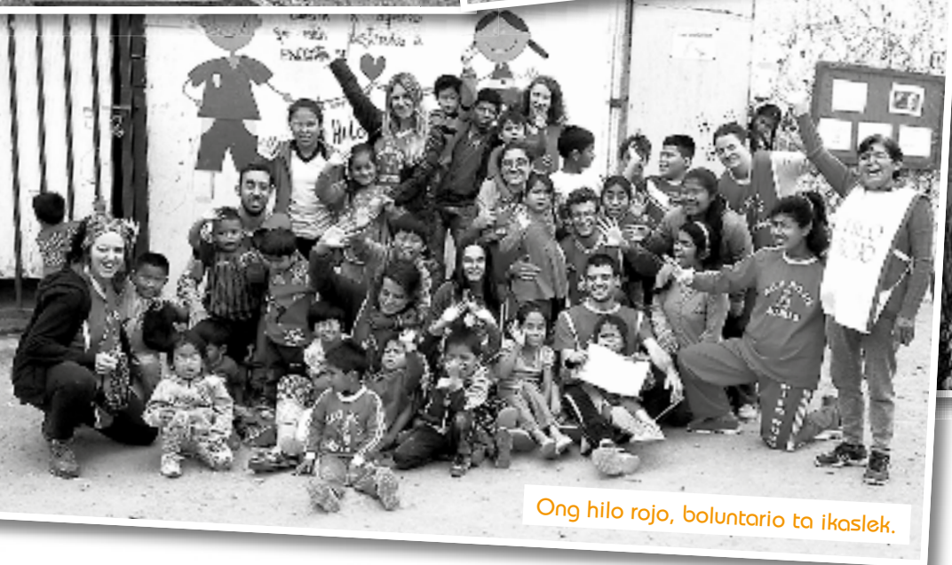
Ong hilo rojo, boluntario ta ikaslek.

Batez ere, Chachapoyas, Tarapoto edo Lagunaseko oihanen.