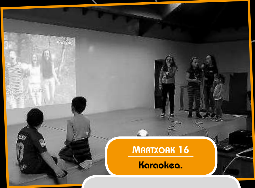
MARTXOAK 16 Karaokea.

Oraindik ere, batzuk, kontutako larunbateko ajea bagenuen ere, herritar ugari elkartu ginen pelikula hau ikustera. Pelikulaz gozatzeaz gain, ikasteko asko daukagula ere ohartu ginen.