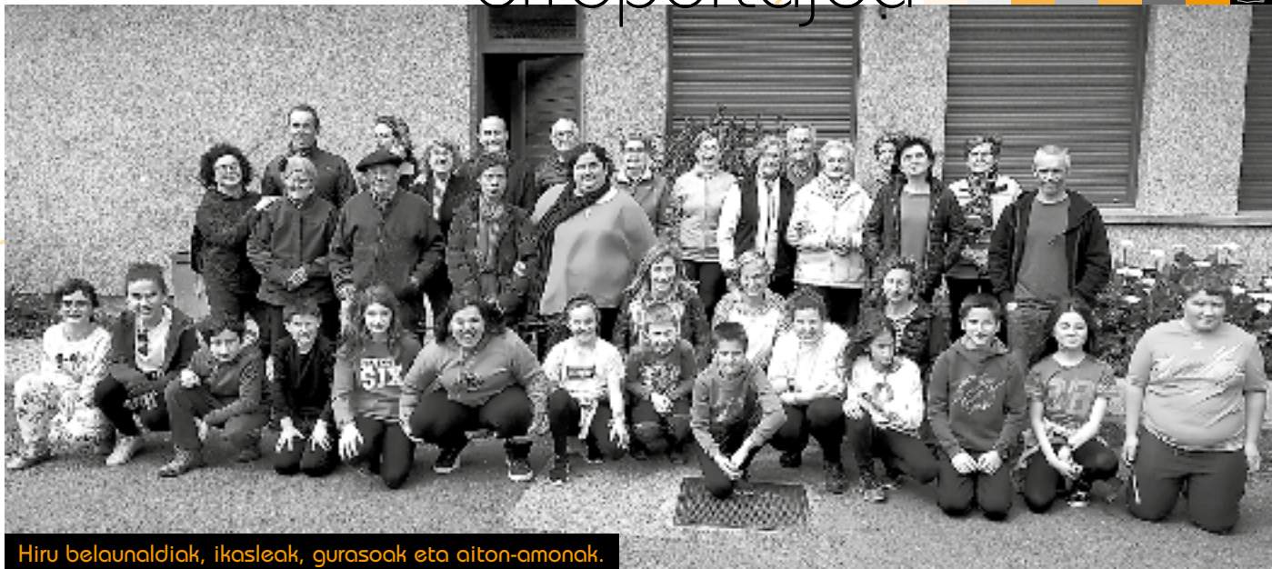
Hiru belaunaldiak, ikasleak, gurasoak eta aiton-amonak.