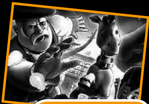
ABENDUAK 30 Olentzero eta subilaren lapurreta.

Gabonetako oporrak aprobetxatuz, haurrentzako zinea antolatu genuen. Arratsalde paregabea pasa genuen bertaratu ginen haur eta helduok olentzeroen abenturak ikusiz.