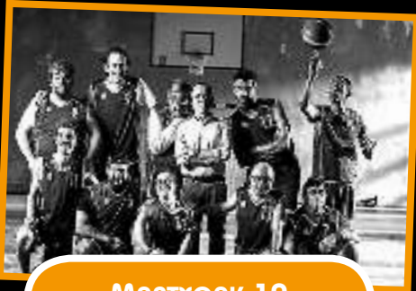
MARTXOAK 10 Campeones pelikula.

“Ordu magikoa” ikuskizuna aurkeztu zigun Hodei magoak eta halaxe izan zen bertaratu ginen haur eta helduontzat. Truko simple nahiz landuak ikusi genizkion eta gutariko batzuk ere parte hartu genuen.